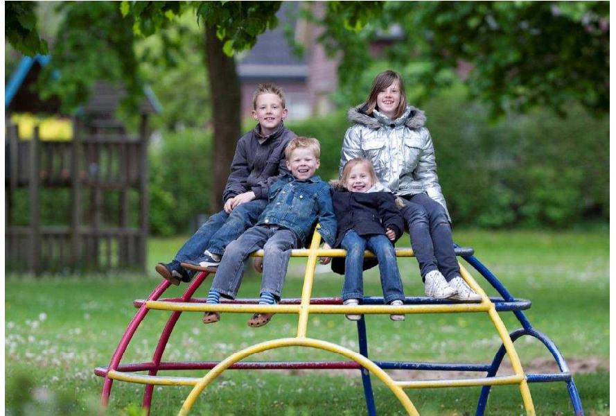
De herinrichting van de openbare ruimte in de Kwartellaan en het Mezenpad gaat starten.