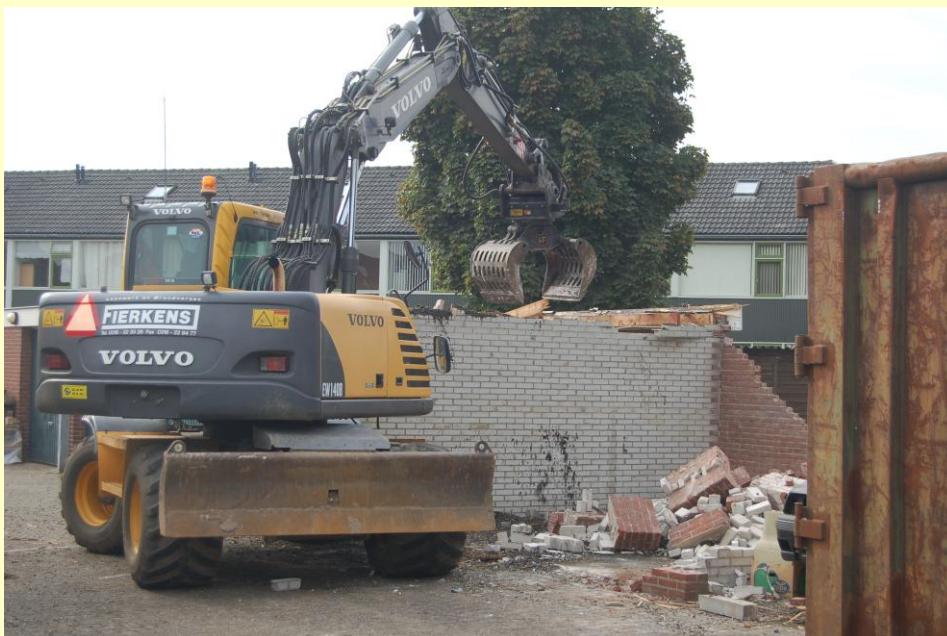
De sloop is in volle gang.