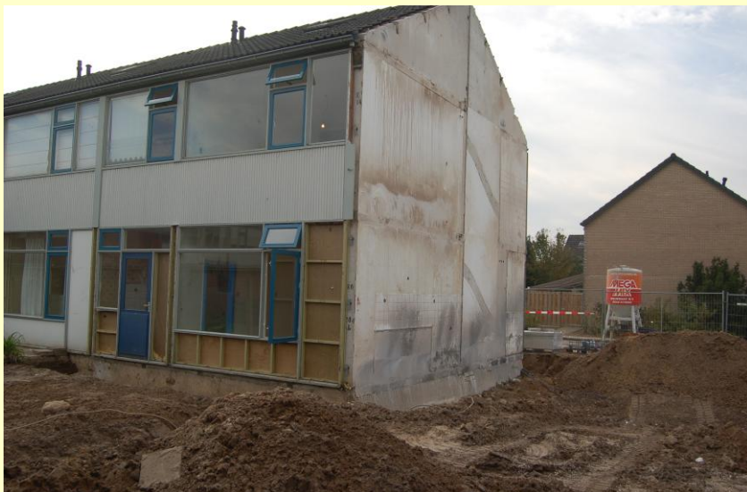
Sloop ten behoeve van de doorgang van Vogelbuurt naar Biezenakker.