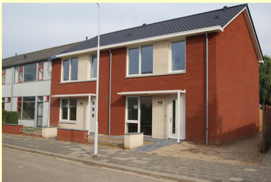
Modelwoning De Parkbuurt springt in het oog door totaal vernieuwde gevel en dak.

Ik ben 's avond al met mijn familie wezen kijken, zo trots ben ik. We moesten wel een zaklamp meenemen, anders konden we niets van de open keuken zien.