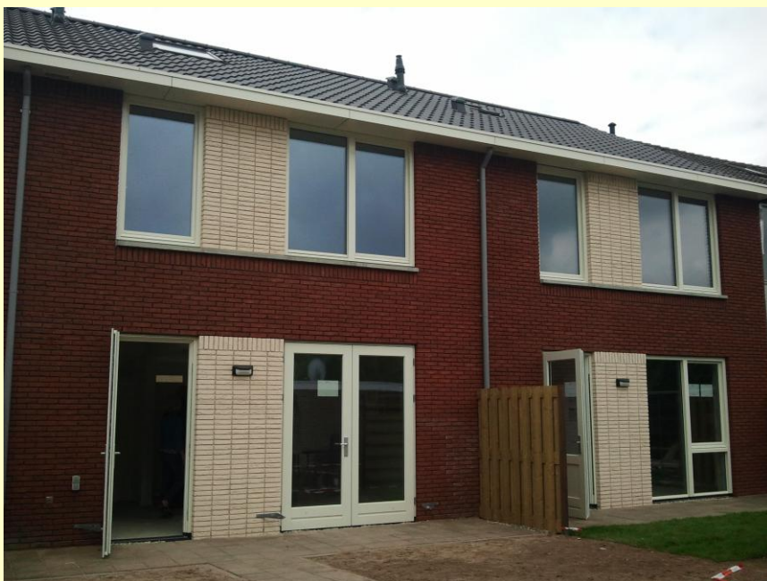
De modelwoningen aan de achterzijde.

Door de woningverbetering gaat de woning van energielabel F naar gemiddeld label A+. U bespaart daardoor vele euro's per maand op uw energierekening.