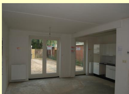
Renovatie geeft ook aan de binnenzijde een totaal ander beeld. Modelwoning met open keuken en openslaande tuindeuren.

Ook de keuzemogelijkheid voor bijvoorbeeld een open keuken, openslaande deuren naar de tuin of een tweede dakraam, worden erg gewaardeerd. Het speerpunt bij de vernieuwing van de woningen ligt op de isolatie van de schil, zodat u straks een energiezuinige woning heeft.