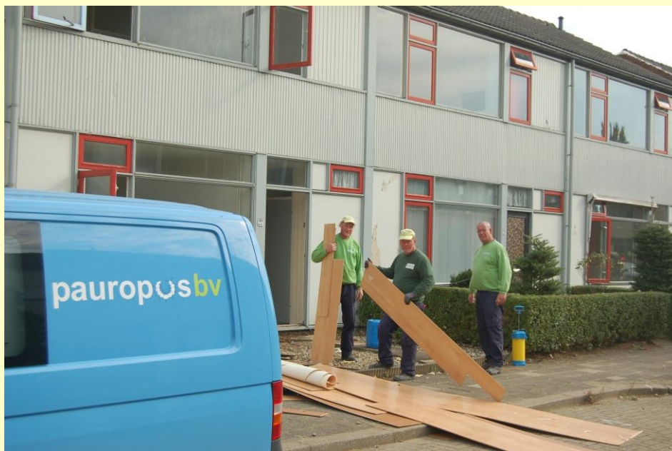
Pauropus maken verschillende woningen in De Parkbuurt klaar voor de renovatie werkzaamheden en strippen de

Ongeveer twee maanden voor de start van de renovatie werkzaamheden aan de eerste woning in De Gaarden ontvangen de bewoners de specifieke planning.