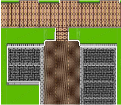
De bestratingkleuren van de voetpaden van het Mezenpad in De Gaarden.