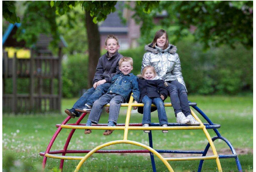
De herinrichting van de openbare ruimte in de Kwartellaan en het Mezenpad gaat starten.