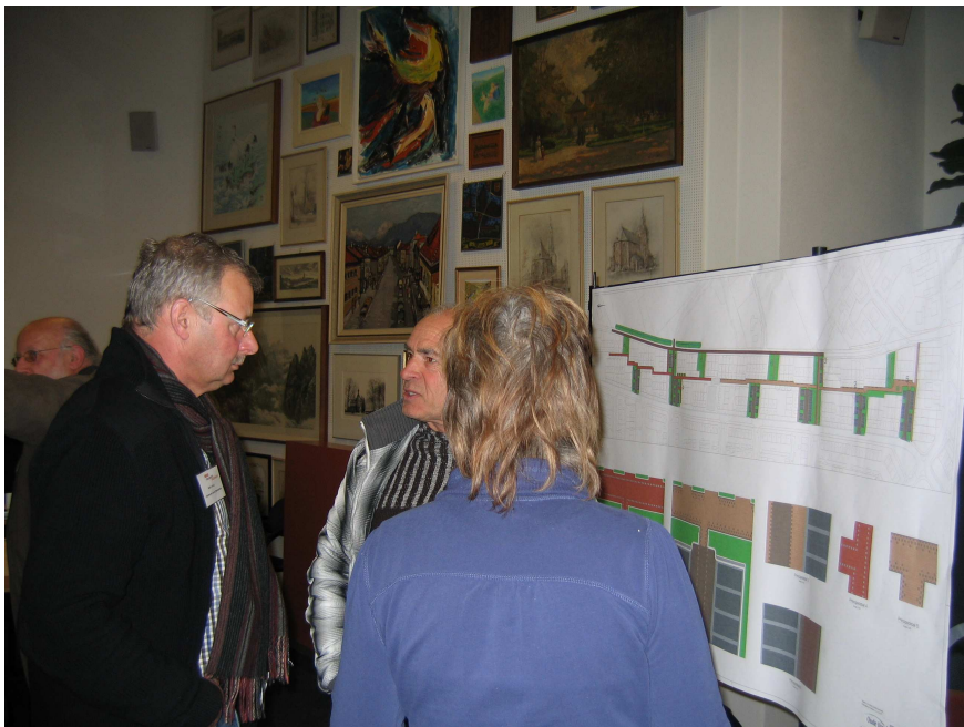
Tijdens de inloopavond van 22 februari konden de bestratingstekeningen bekeken worden.