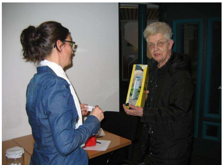
Eén van de prijswinnaars van de energieneutrale tuinlamp.

Wonion is erg blij met de informatie uit de enquêtes. De resultaten neemt zij dan ook mee in de komende projecten. Uit alle ingezonden enquêtes zijn twee prijswinnaars verloot. Zij wonnen een energieneutrale tuinlamp.