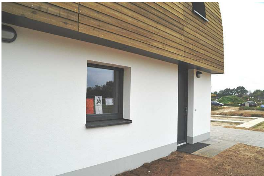
De eerste woningen in Bomenbuurt zijn al enige tijd zichtbaar. Begin 2012 krijgen de eerste bewoners hun sleutel.