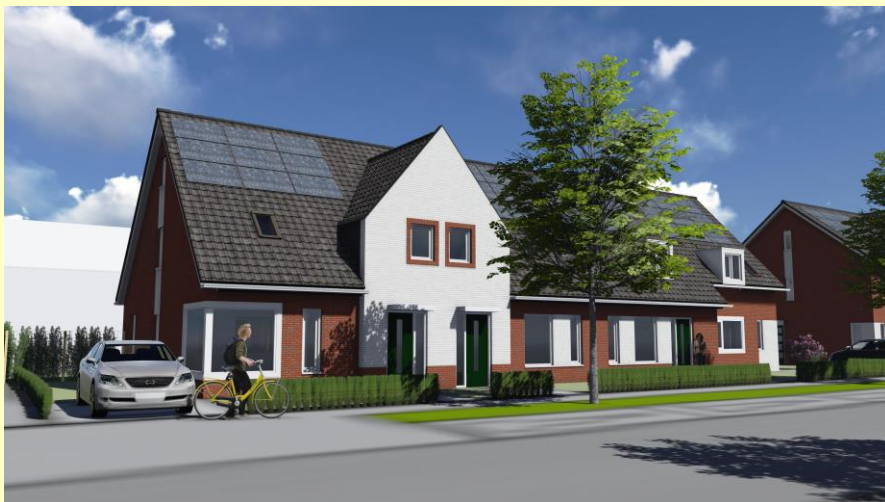
Een voorbeeld van de nieuwe woningen in uw buurt.