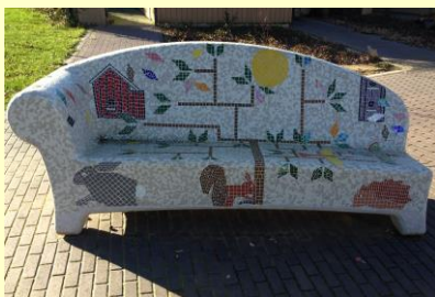
Vrolijke kunst bij de speelplek aan Het Bosveld

Wij hopen dat de bewoners ook trots zijn op hun wijk en hier met veel plezier wonen.