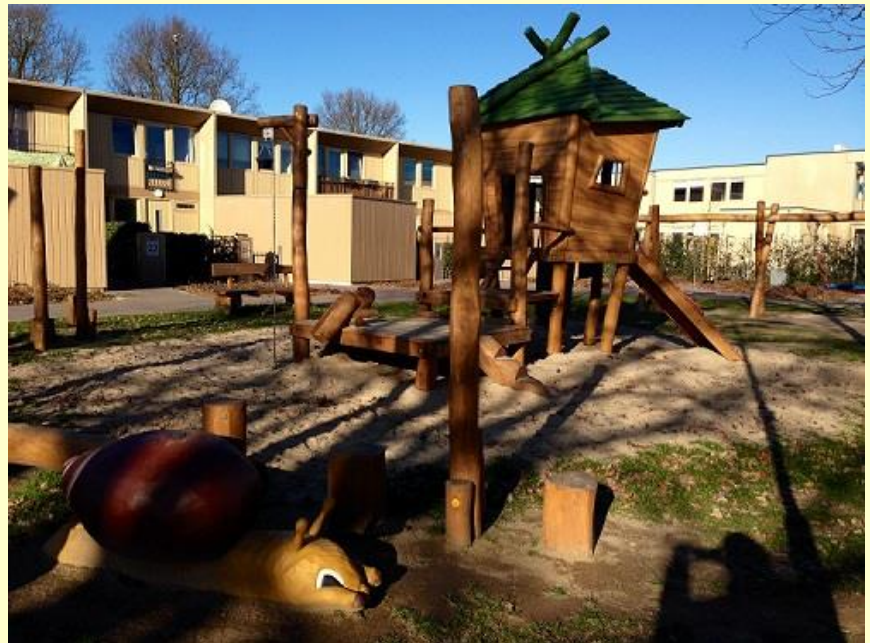
Een mooie speelplek voor de jeugdige bewoners van Het Bosveld

Speelplek Het Bosveld: een kunstwerk, een speelplek en een plaats voor de vogels!