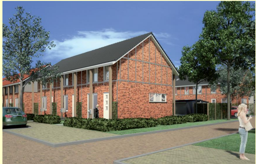
Een gevelbeeld in de Eksterstraat van de nieuwe woningen in De Gaarden