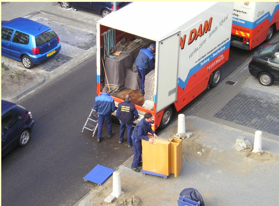
De verhuizers van Van Dam in actie!

De wisselwoning wordt schoon opgeleverd en is ingericht op een verblijf van enkele weken. De woning is voorzien van vloerbedekking en (rol)gordijnen en is behangen (of gesausd). Uw TV en radio kunt u aansluiten op de in de woning aanwezige kabelaansluiting en er is een aansluiting voor uw wasmachine en gaskooktoestel. En natuurlijk is er verwarming, (warm) water, gas en elektriciteit in de woning. Verder krijgt u de beschikking over een postbus zodat u uw adresgegevens niet over hoeft te zetten naar de wisselwoning.