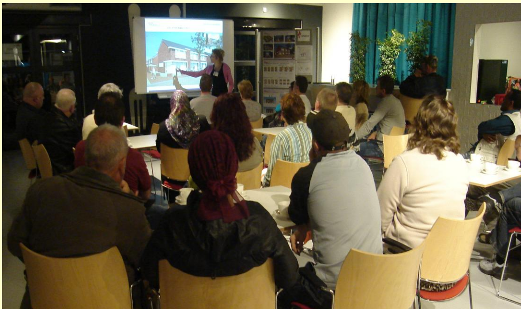
Uitleg van de architect.