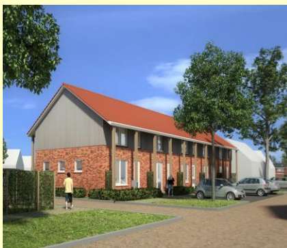
De gevel aan de Kwartellaan.

'Ik vind het prachtig worden en kan niet wachten tot er gestart wordt! Kunnen jullie morgen niet beginnen?'