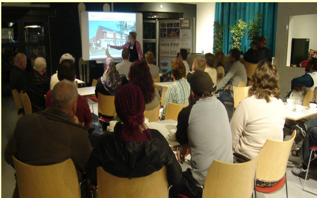
Uitleg van de architect