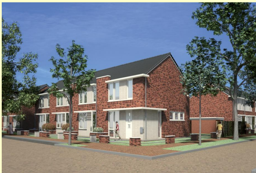
Een gevelbeeld van de nieuwe woningen in De Parkbuurt.