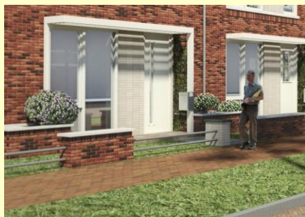
De gevel aan de andere zijde.

'Ik vind het prachtig worden en kan niet wachten tot er gestart wordt! Kunnen jullie morgen niet beginnen?'