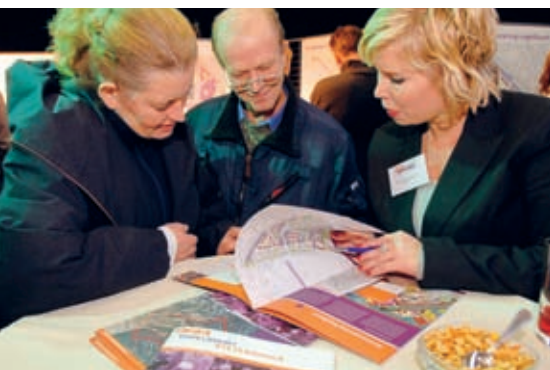
Tijdens de bewonersbijeenkomsten kregen bewoners de mogelijkheid het Masterplan voor de wijk te bekijken.

kamer op de begane grond, kan ik nog een lange tijd in de Vogelbuurt blijven wonen," aldus een wat oudere bewoner. Hoewel het merendeel van de bewoners positief is over de plannen, hebben bewoners ook hun bedenkingen. Er werden relatief veel vragen gesteld over de noodzaak van het verdwijnen van de garageboxen. Ook werd er regelmatig gevraagd naar de toekomstige functie van de kringloopwinkel. Op dit moment is daarover in het plan nog niets opgenomen. De gekozen locatie voor de multifunctionele accommodatie (MFA) is goed ontvangen. Dat nog niet bekend is hoe de MFA ingevuld zal worden, vonden bewoners niet vervelend. Ook werd de groenverdeling enthousiast ontvangen: de locaties voor trapvelden en groen zijn goed gekozen volgens de bewoners.