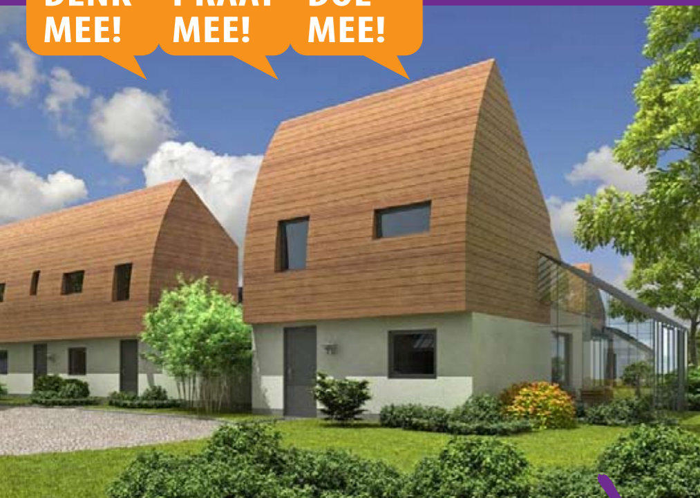
Sfeerbeeld toekomstige woningen Bomenbuurt, onderdeel van de Biezenakker.

Eind 2008 heeft de gemeenteraad het Masterplan voor de Vogelbuurt/Biezenakker vastgesteld. Achter de schermen wordt hard gewerkt om het plan verder uit te voeren. Het is bekend dat ook de Achterhoek op dit moment hard getroffen wordt door de economische recessie. In de Achterhoek en daarmee ook in gemeente Oude IJsselstreek, wordt gekeken hoe de economie gestimuleerd kan worden. Hierbij kijken wij ook naar welke bouwprojecten wij versneld kunnen uitvoeren.