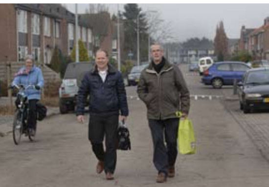
Medewerkers van Wonion bezochten begin dit jaar alle huurders van de Vogelbuurt thuis.

Nadat wij u het Masterplan voor de wijk Vogelbuurt/Biezenakker hebben gepresenteerd, hebben twee medewerkers van Wonion alle huurders in de Vogelbuurt thuis bezocht. Tijdens deze huisbezoeken gaven zij uitleg over de plannen voor de buurt en het Sociaal Plan. Daarnaast hebben zij in kaart gebracht welke woonwensen huurders in de Vogelbuurt hebben. Wonion vindt het belangrijk te weten welke woonwensen haar huurders hebben: willen zij graag binnen of buiten de wijk blijven wonen, in Ulft of elders? Naar welk type woning willen zij graag terugkeren?